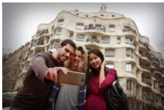
TOP 5 NACIONALIDADES DE VISITANTES DE LA PEDRERA 2017

Por lo que se refiere al origen de los visitantes, los americanos son el público más habitual, seguidos de los chinos. Casi el 40% de los visitantes son de origen europeo. Italianos, franceses y españoles figuran en el top 5 de nacionalidades de visitantes de La Pedrera durante el 2017.