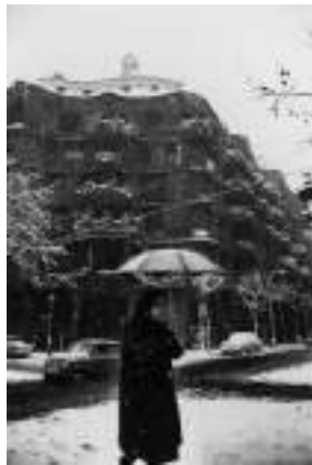
Autor: Xavier Miserachs

La UNESCO inscribe La Pedrera como Bien Cultural del Patrimonio Mundial por su valor universal excepcional (ref. 320bis.).